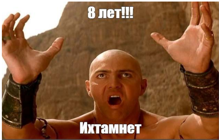
Joonis 1. Imhotep (Muumia tuleb tagasi): „8 aastat!!! Neid seal ei ole.“

Ametlik versioon, et Venemaa ei osale võitluses Donbassis (konteksti vt Denisova 2019, 59–60), viis meemideni, mis naeruvääristavad vastuolu Vene sõjaväelaste ja vabatahtlike massilise kohalolekuga rindejoonel, alustades kuulsast haaksõnast Ихтамнет („neid seal ei ole“, vt joonis 1).