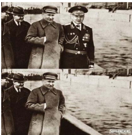
Joonis 8.

Peaaegu kõigis meemides võrdub Stalin „suure terroriga“ ja viitab paljude inimeste küüditamisele ja tapmisele. Putinit võrreldakse Staliniga nii sõda toetavates kui ka sõjavastastes meemides. Sõda toetavates meemides kritiseerib Putinit vene ühiskonna radikaalsem osa, kes süüdistab teda liigses pehmuses ja liberalismis ning nõuab, et ta rakendaks karmimaid meetmeid ja Stalini samme järgides algataks taas suurpuhastuse. Tähtendused on siin ümber pööratud ning Putin näib Stalini nõrga koopiana. Sõjavastastes meemides ilmub ta kui tänapäeva Stalin. Näiteks on Putin asetatud kuulsale Stalini ja tema kaaskonna fotole, mida muudeti poliitiliste repressioonide käigus, et kõrvaldada pildilt tapetud Nikolai Ježov (joonis 8). Meem vihjab järgmiste kadumiste võimalusele „teise Stalini“ võimu all. Fotol on Stalini nägu asendatud Putini omaga ja Ježov (siseasjade rahvakomissar) on asendatud Šoiguga kindrali mundris.