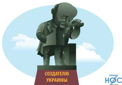
Joonis 4. Kiri monumendil: „Ukraina loojale“. Tekst: „Kui Lenin mõtles välja Ukraina, ta justkui heitis õlult raske koorma. Kuid vaevalt ta mõistis, et paneb enda loodud liidule miini alla.“

Teine ukraina meem 10 isegi soovib, et Lenin tuleks Ukraina loomise eest mausoleumist välja võtta ja maha lasta. Sõda toetavad meemid aga kasutavad harva Lenini kujutist või fakti, et teda peetakse Ukraina loojaks. Ainuke sõda toetav meem meie andmestikus, mis sellele viitab, kujutab nutvat Leninit ja annab mõista, et tal ei jätkunud poliitilist taipu (joonis 4).