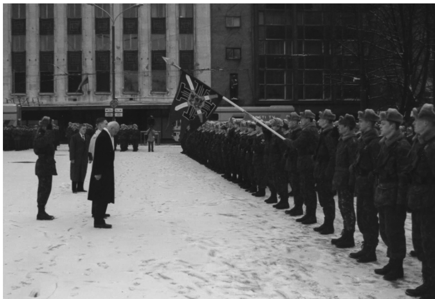
President Lennart Meri tervitamas 1993. aasta veebruaris kolledži paraadkompaniid.