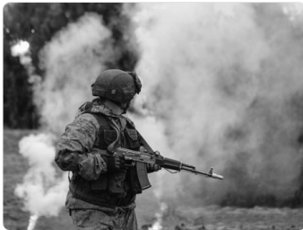
3:46 AM - 2 Nov 2016

mastaapi ja iseloomu puudutavaid sõnumeid ning soodustas lahkkelide suurenemist uute ja vanade ELi liikmesriikide vahel, sõites eeldatava venevastase hüsteeria lainel, mille olid tekitanud just uued liikmesriigid. Tõenäoliselt kasutati õppust NATO (ja USA) ning ka Ukraina infopoliitika olulise elemendina, et vastata Vene propagandamasinale. Ukrainast tulnud sõnumid, millega löödi häirekella, võrdsustati Lääne poliitikute sarnaste väljaütlemistega, nagu juba nägime eespool. 19