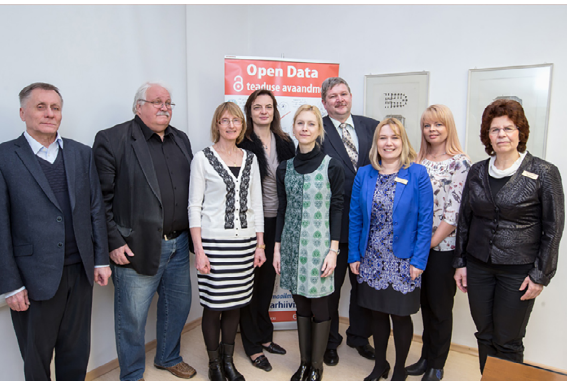
DataCite Eesti konsortsiumi asutajaliikmete ümarlaud (2.04.2015).