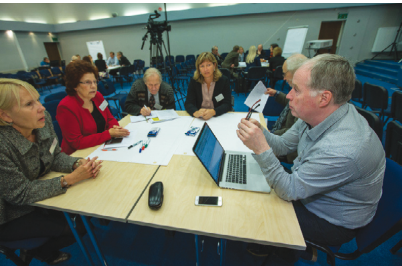
Diskussioon seminaril „Avatud teaduse poliitika arengutest Eestis“ 27.10.2015.