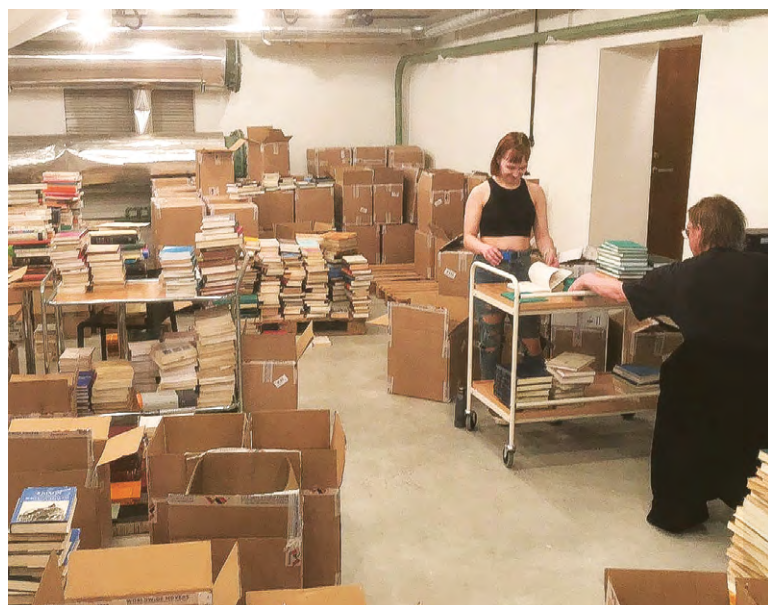
Usuteaduskonna kolleegid tööhoos.