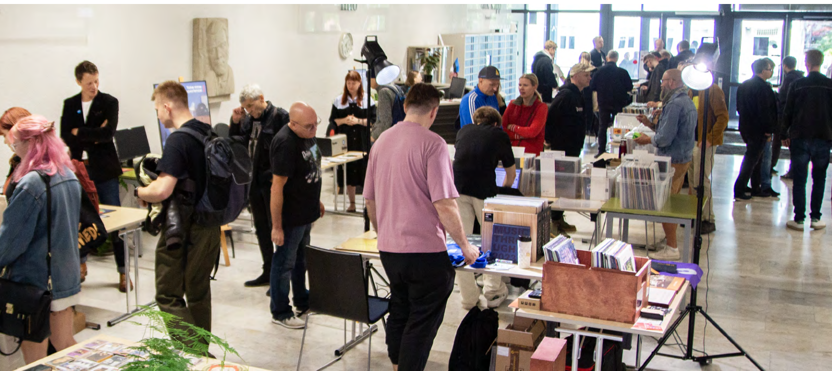
Vinüülplaadilaat raamatukogu fuajees.

inspiratsiooniks juurdepääsu haruldastele või raskesti kättesaadavatele salvestistele-nootidele; muusikaentusiastid ja kolleksionäärid; raadiojaamad (peamiselt Klassikaraadio, aga ka näiteks Pereraadio) ja konkreetsed saatejuhid. Nn mitteakadeemilisele lugejaskonnale on lisaks muusikasalvestistele pakkuda erinevatel tasemetel üldharivaid materjale: õpikuid-käsiraamatuid, audio- ja audiovisuaalseid teavikuid iseõppimiseks või muusika kohta (rohkem) teada saamiseks, lihtsamate muusikateoste noote jms.