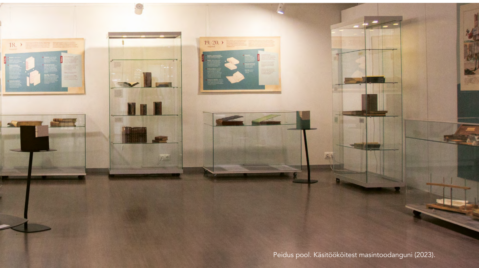
Peidus pool. Käsitöököitest masintoodanguni (2023).

1 Näituse materjalid: hdl.handle.net/10062/98790 .