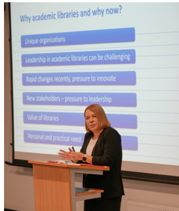
Doktoritöö kaitsmine 24.10.2024