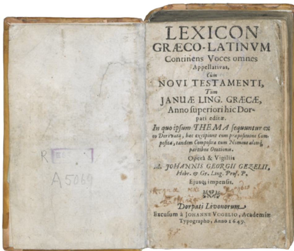
Johannes Gezelius vanema kreeka-ladina sõnaraamat „Lexicon Graeco-Latinum” (Dorpat, 1649). TÜR, R Est.A-1649