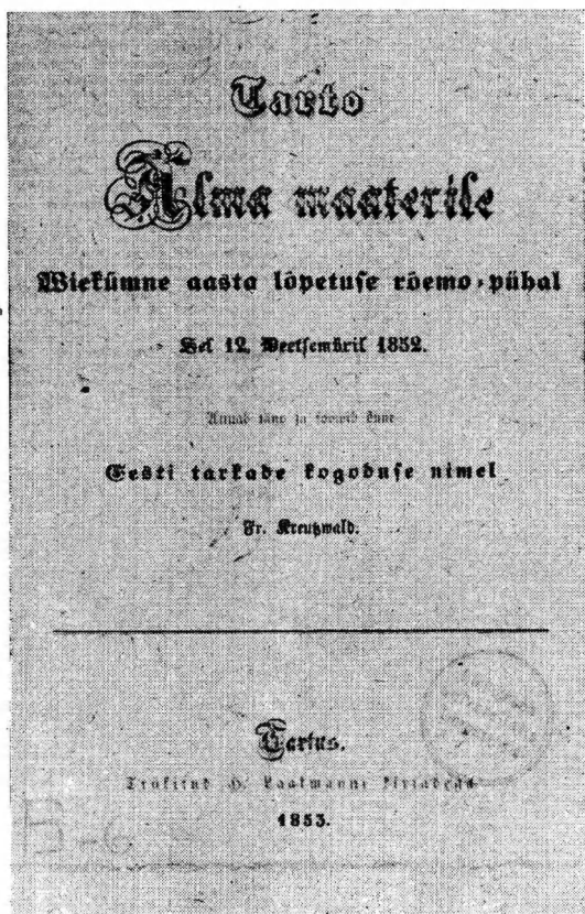
Fr. R. Kreutzwaldi tervitusluuletuse Tartu ülikooli 50. aastapäevaks teise väljaande esilehekülj.

1852. aastal 12. detsembril pühitseti Tartu ülikooli rajamise 50. aasta juubelit. Õpetatud Eesti Selts kui ülikooli juurde kuuluv asutus võttis omaltki poolt osa sellest juubelist. Sel puhul telliti