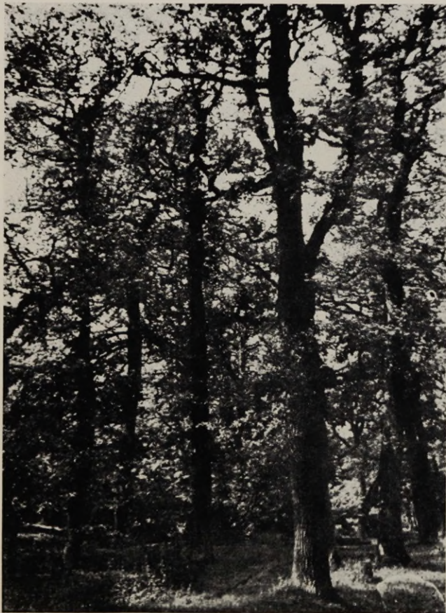
Joon. 6. Vinni tammiku pargitaoline osa.