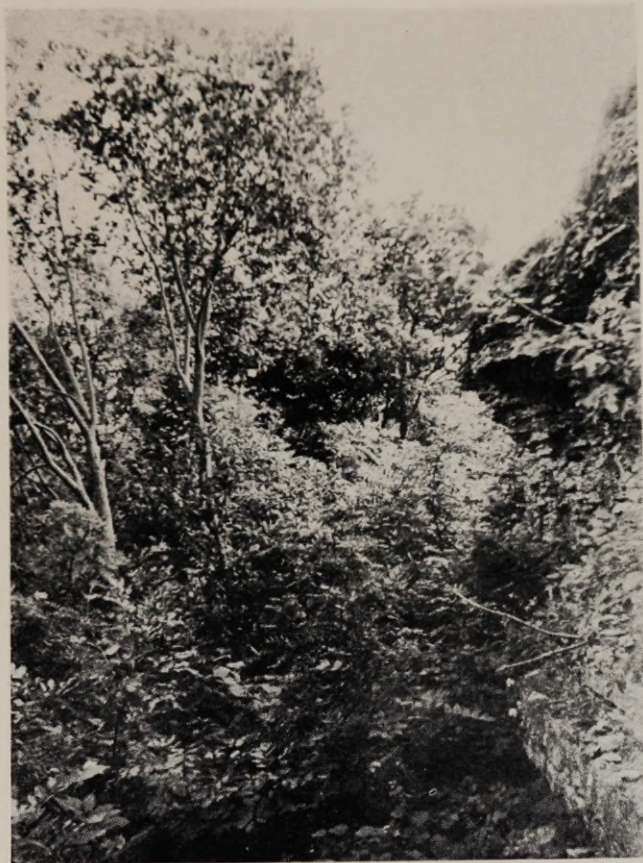
Joon. 2. Glindialune laialeheline lehtmets Ülgasel (Harju raj.).