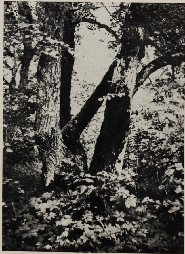
Joon. 7. Pärnade grupp Lehmja laialehelises lehtmetsas (Harju raj.).