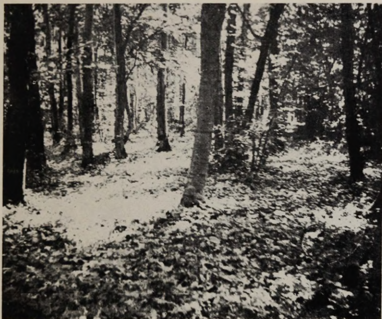
Joon. 4. Vinni tammik (Rakvere raj.). Rohurindes Hepatica nobilis-Pulmonaria officinalis 'e ühing.