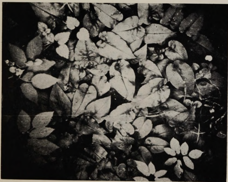
Joon. 5. Detailfoto Hepatica nobilis-Pulmonaria officinalis 'e ühingust Vinni tammikus.