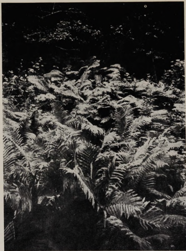
Joon. 3. Struthiopteris filicastrum 'i kogumik glindialu- ses laialehelises lehtmetsas Toila juures (Jõhvi raj.).