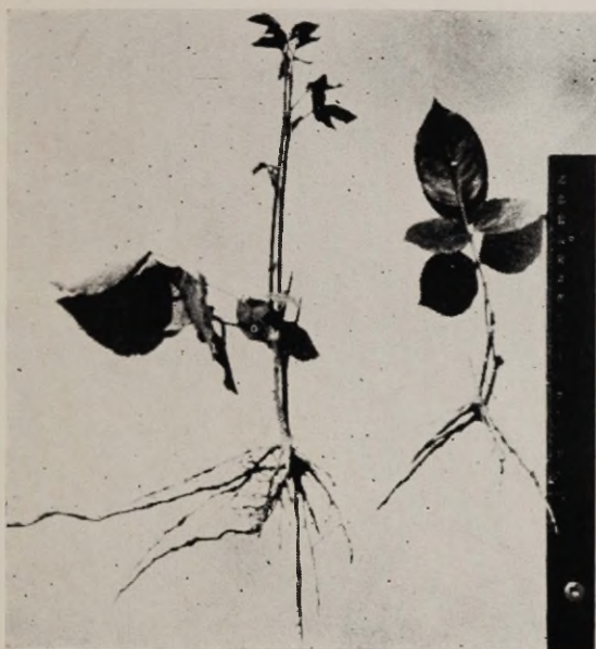
Joon. 9. «Hadley», suurem stimuleeritud heteroauksiiniga, väiksem kontroll.