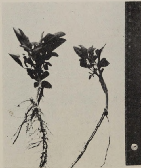
Joon. 8. «Crimson Rambler» suurem stimuleeritud heteroauksiiniga, väiksem kontroll.