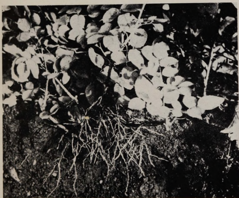
Joon. 14. «Fisher ja Holmes» (võrsikud).