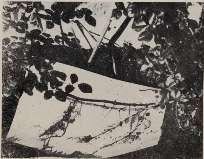
Joon 12. «New-Dawn» (võrsikud).