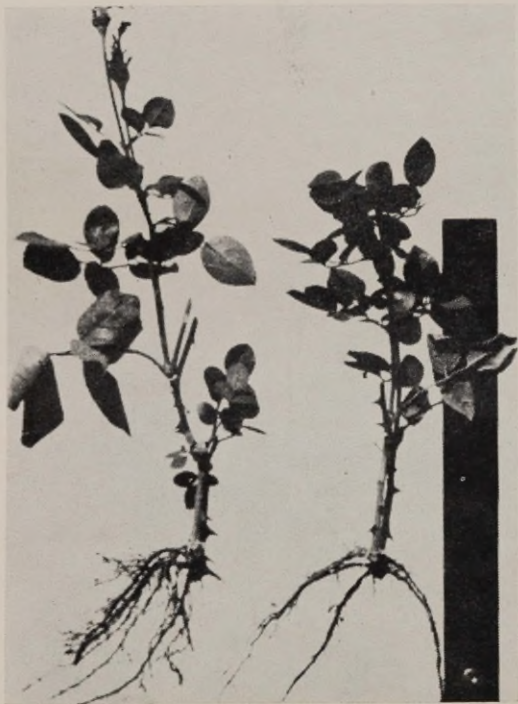
Joon. 3. Sordi «New-Dawn» pistikud alumise lehega.