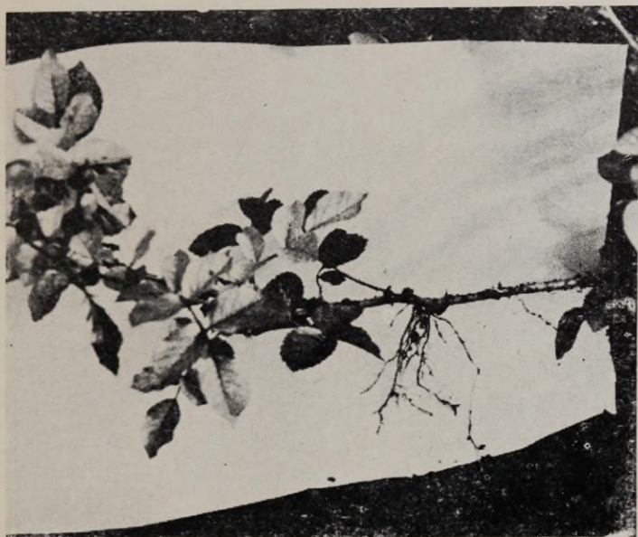
Joon. 13. «Orange Triumph» (võrsikud).