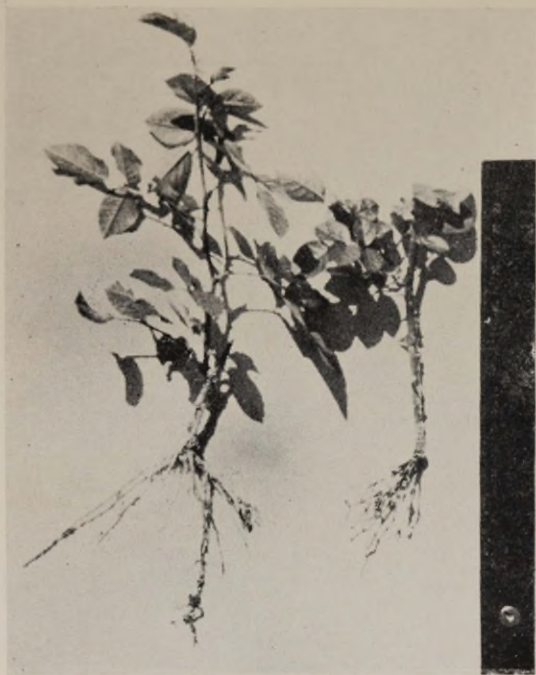
Joon. 5. «Orange Triumph», suurem stimuleeritud heteroauksiiniga, väiksem kontroll.