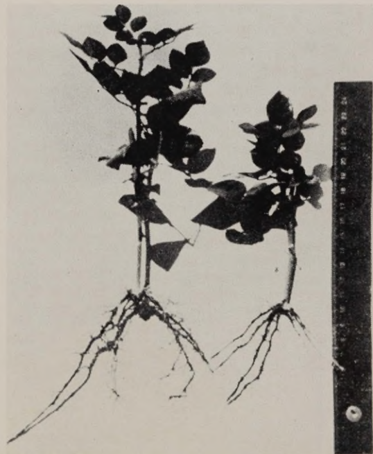
Joon. 4. Sordi «New-Dawn» pistikud alumise leheta.