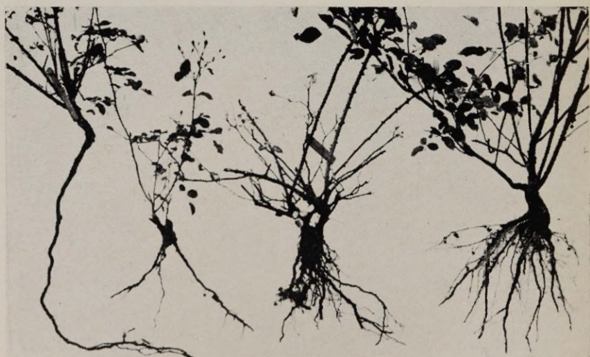
Joon. 16. Juurehtsad roosid. Vasakult paremale: «Hadley», «Orange Triumph», «New-Dawn», «Frau Karl Druschki».