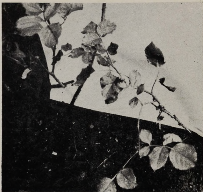
Joon. 15. «Hadley» (võrsikud).