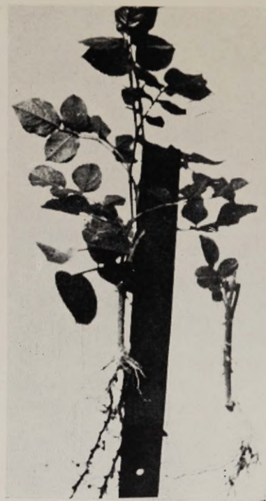
Joon. 2. Sordi «Orange Triumph» pistikud alumise lehega.