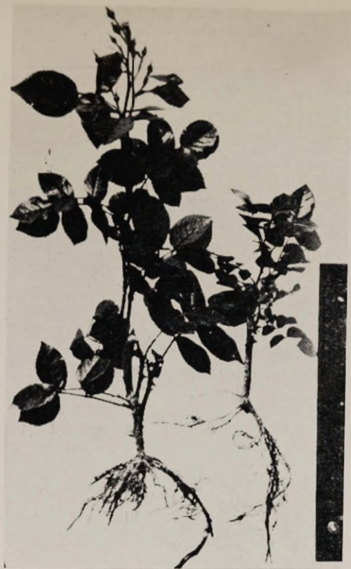
Joon. 1. Sordi «Orange Triumph» pistikud alumise lehega.