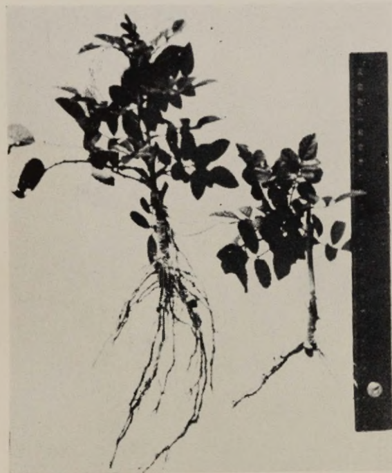
Joon. 7. «Dorothy Perkins» suurem stimuleeritud heteroauksiiniga, väiksem kontroll.