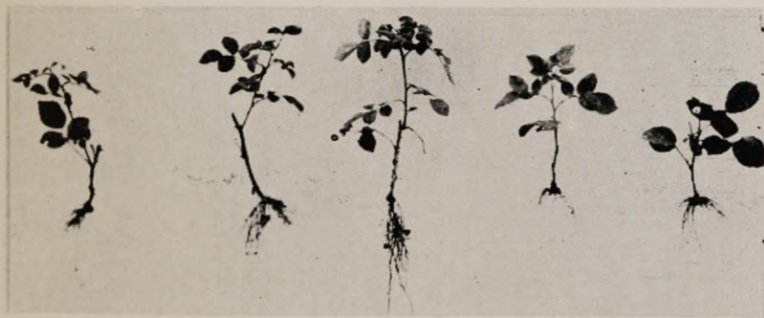
Joon. 10. Stimuleeritud pistikute juurdumine avamaal. Vasakult paremale: «New-Dawn», «Orange Triumph», «Frau Karl Druschki», «Ulrich Brunner», «Hadley».