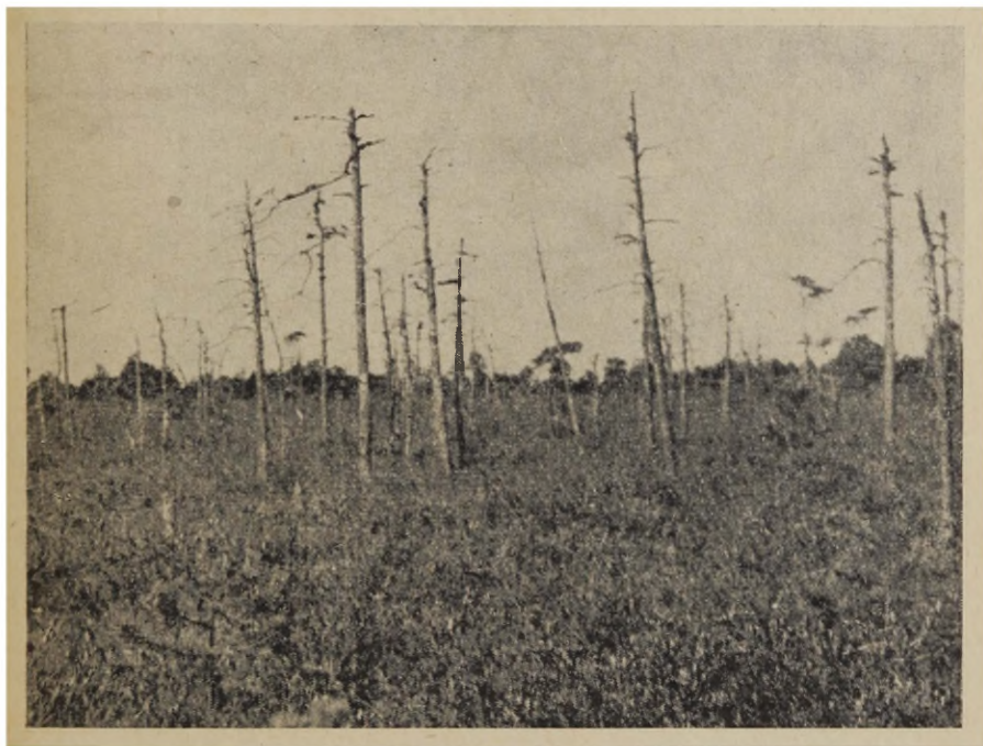
Joon. 4. Kahekümneaastane rabamänniku-põlendik Endla raba põhjaosas. Kuivanud männitüved on ikkagi veel püsti; männiuuendus nõrk. Puhmarinne tugevasti arenenud.

selt uuenenuna ja tupp-villpea vähesus. Samblarindes katab Polytrichum strictum kohati 50%. Sfagnumkate esineb (peamiselt S. fuscum ja S. acutifolium ) ümmarguste, 15—70-cm-se läbimõõduga laikudena, S. magellanicum ja S. angustifolium veelgi väiksemate padjanditena. Rohkesti seemnelist uuendust sookailul ja kanarbikul, vähem hanevitsal.