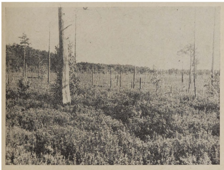
Joon. 3. Üle kümne aasta vanune põletik Kongi raba servas. Puhmarinne on taastunud ja väga vitaalne.

Puud puuduvad (peale servas püstijäänud männitüvede, joon. 3). Rohu-puhmarindes domineerib tihe, 30—40 cm kõrgune