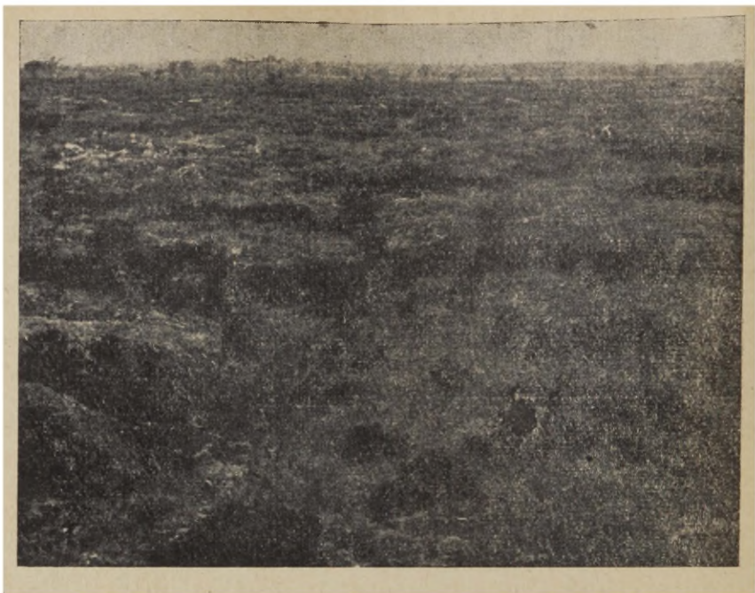
Joon. 2. Üheaastane lageda älveraba põlendik (Piila raba). Älvestes (heledamad laigud) on murusalt uuenenud mättataim — kanarbik, mättad on peaaegu täiesti paljad.