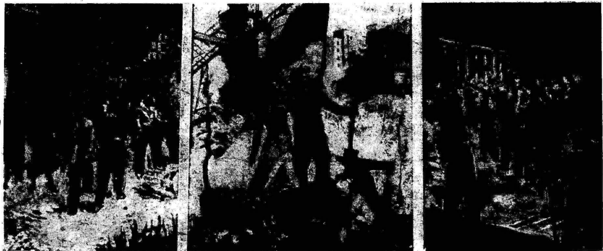
E. Kīts «Võim Internatsionaali...» 1940.