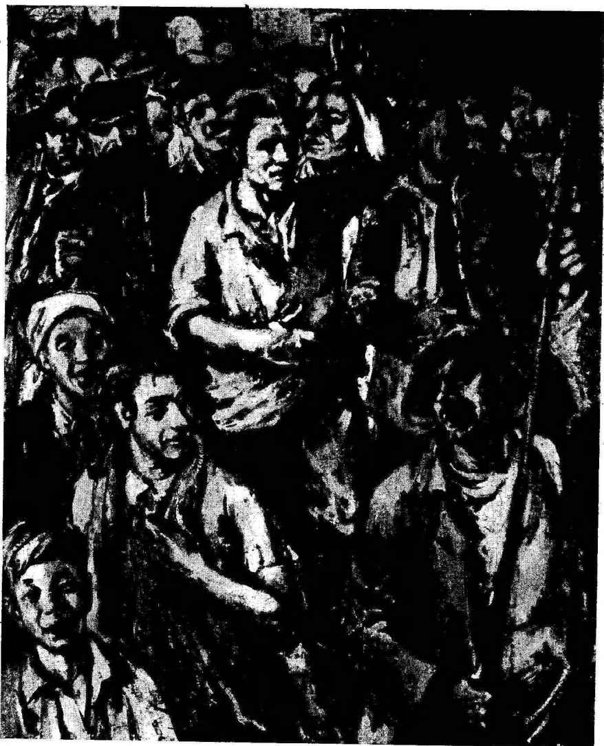
A. Johani «Töörahva ülestõus 21. juunil 1940. a. Tartus» 1941.