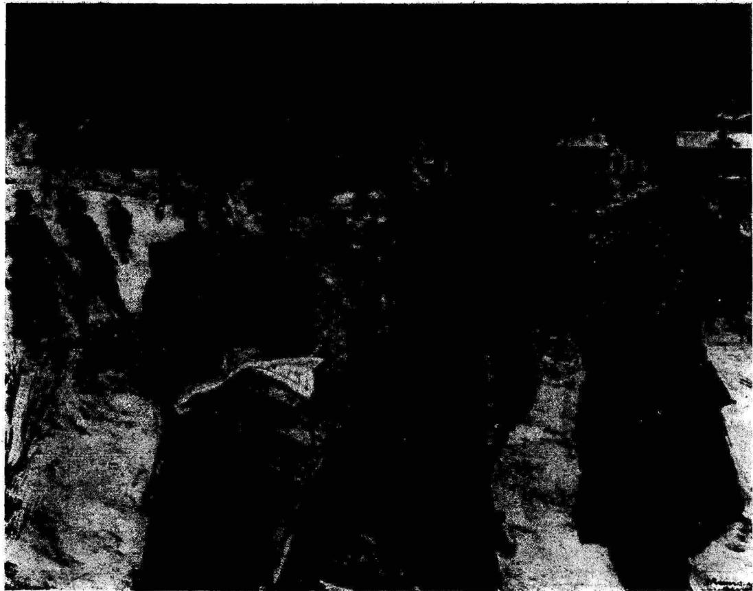
O. Raunam «Eesti punakaartlased Rak- vere länistel 1918. a.» 1948.