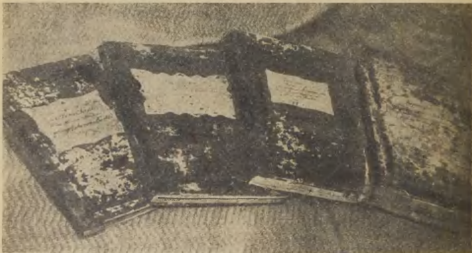
TÜ Raamatukogu laenutusraamatud, kus leidub Fr. R. Kreutzwaldi nimi.

Fr. R. Kreutzwaldi kui raamatute laenaja nimi esineb 4 laenutusraamatus, ja nimelt: 12