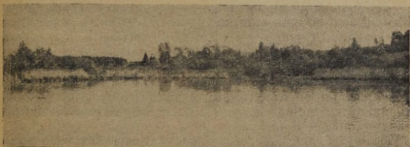
Joon. 3. Vaade Pikkjärve kagusopile. On näha Navaoja algus, mis on täis kasvanud.