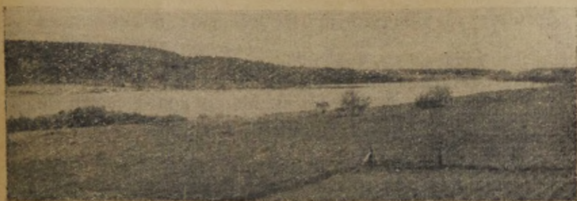
Joon. 2. Vaade Pikkjärvele läänest. On näha kirdekaldas asuv pool-saar.