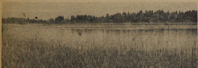
Joon. 4. Vaade Prossa järve kagupoolsele otsale. Vasakul madala metsa kohal on Kohinaoja umbekasvanud algus.

Kaldad on enamasti madalad, kohati õõtsikud. Eriti soostunud on järvede otsad. Autoga pääseb kummagi järve ligi vaid paaris kohas, kus on kõvem kallas ja ühtlasi nootaloomusekohad. Praegu ei ole kumbki järv õõtsikkalda tõttu täiesti läbipüütav. Kinnikas-