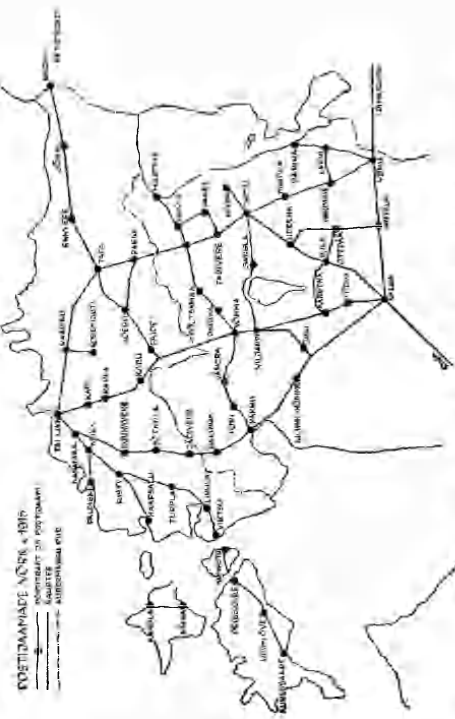
— VIII—Morgens (1815) Pöytäkirja ja Värdin postijärjestelmä vuodelta 1815.