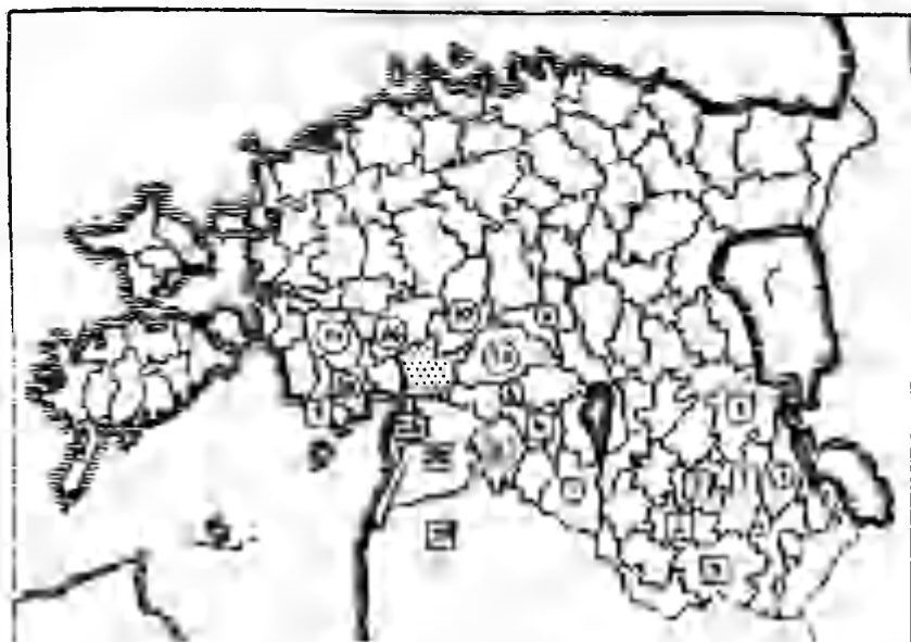
Joonis 2. Tori kihelkonna talurahva migratsioon 1816—1858.