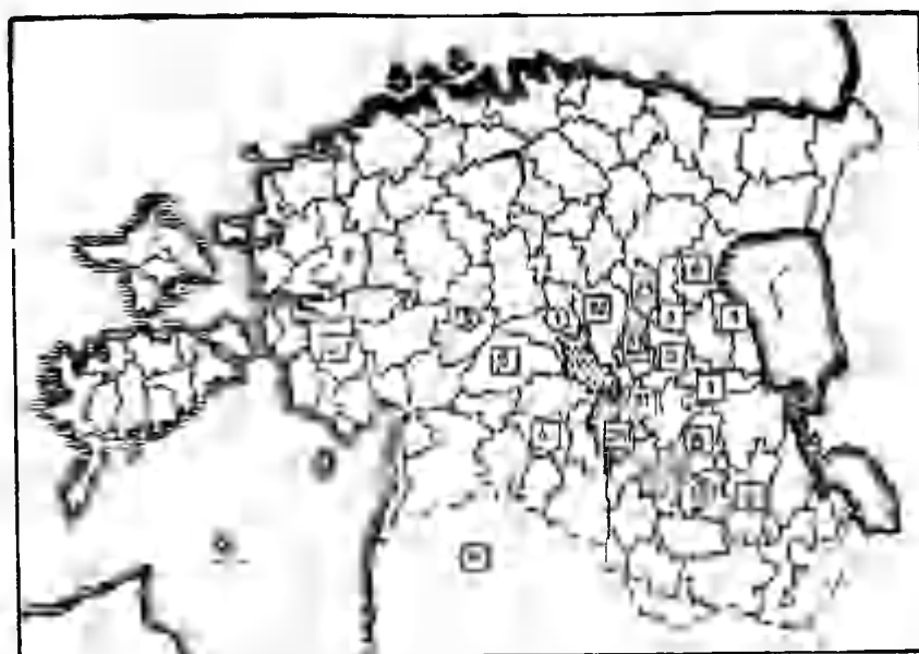
Joonis 3. Kolga-Jaani kihelkonna talurahva migratsioon 1834—1850.