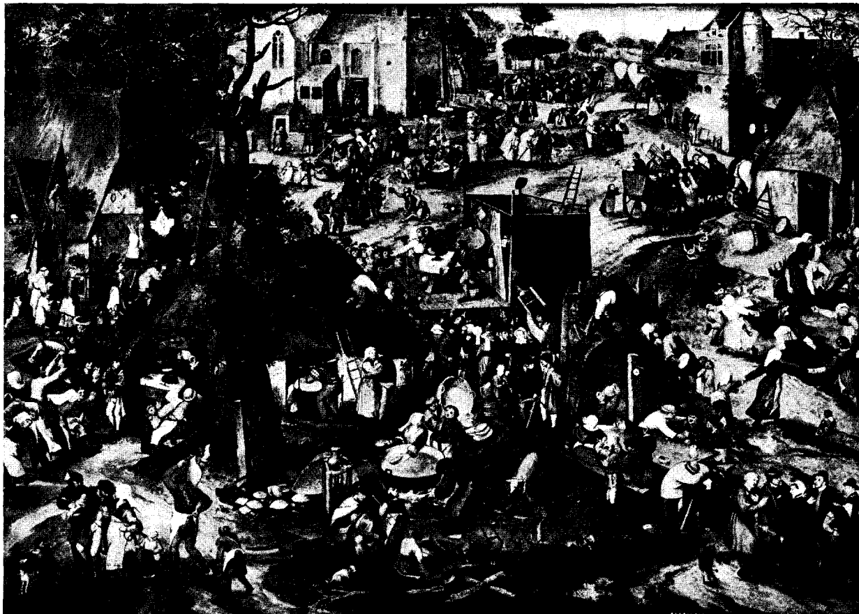
Peter Balten (Custodis), De Kermis op het Dorp. (Amsterdam, Rijksmuseum, nr. 425 a.)