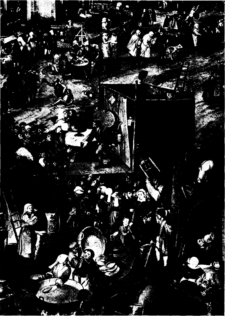
Peter Balten (Custodis), De Kermis op het Dorp (Ausschnitt). (Amsterdam, Rijksmuseum, nr. 425 a.)