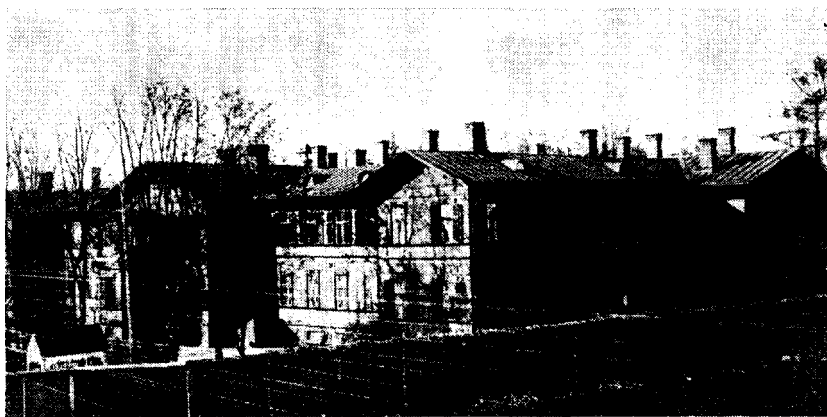
Vaimu- ja närvihaigustekliinik